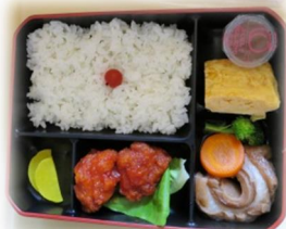
（写真は小学生用です）