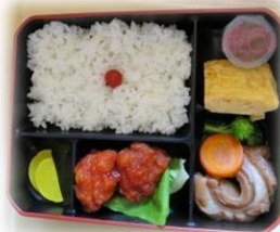
（写真は小学生用です）