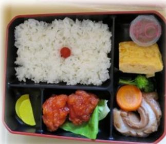
（写真はこども用です）